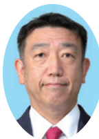
北村 哲夫 議員 (54歳)