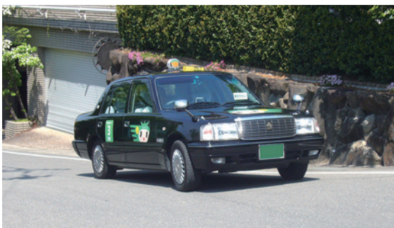
買い物などの暮らしを支える交通手段として、北条・野崎・寺川・中垣内地区の主に東側を全5コースで運行している「乗合タクシー」