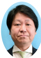
石垣 直紀 議員 (56歳)