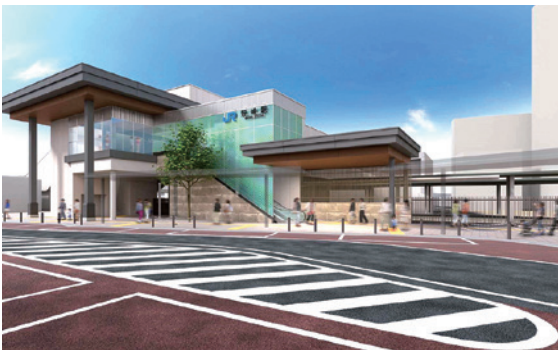
野崎駅周辺整備完成予想図 ※予想図ですので実際とは異なる場合があります。

A 施設管理者のJRに要望しており、JRからは年内完了予定の東側エスカレーター及び