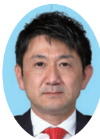
品川 大介 議員 (46歳)