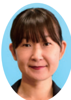
野上 裕子 議員 (49歳)