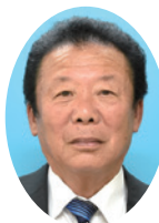
中河 昭 議員 (78歳)