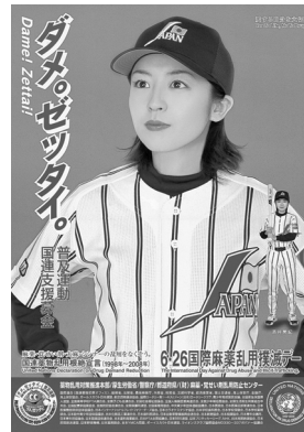
麻薬乱用撲滅のポスター

今期定例会では、13人の議員から一般質問がありました。各議員から申し出のあった質疑を掲載しています。その他の一般質問は7ページの一覧表のとおりです。