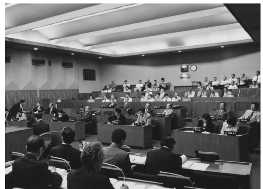
自主的の改革に取り組む大東市議会

15年度国民健康保険特別会計の補正予算は、14年度において収納率の向上や一般会計からの繰り入れ等により、