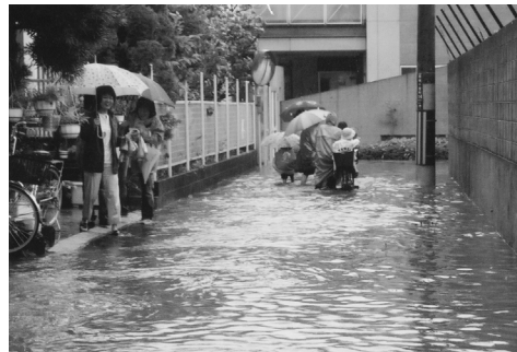
浸水被害のあった四条北小学校付近

増補幹線が工事中で、16年6月頃の完成予定です(工事費約44億円)。全体的な完成年度は未定です。また、現在利用している「大東 四条線」の下流部の大東中央公園予定地内で、地下貯留池(貯留量5万7千)が工事中であり、大雨による雨水増量時に貯留し、浸水被害を軽減します(13年8月着工、18年度完成予定/大阪府工事費約60~70億円)。