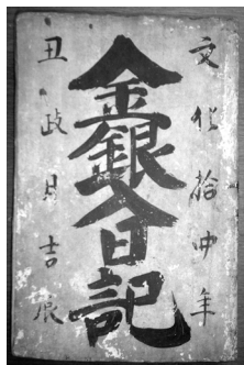
現在、整理・解読している古文書

調査報告書によりますと、文化遺産としての修景、保存が望まれ、歴史的遺産として保存すべく、財政状況と考える合わせながら、要望に沿うべく努力していきます。