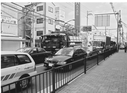
渋滞の多い赤井交差点付近