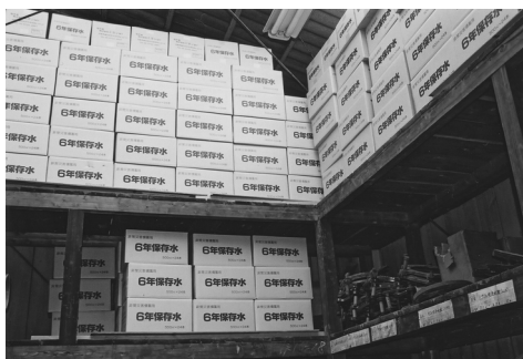
飲料水などを備蓄している水道局