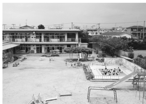
入園希望の多い市立諸福幼稚園

本市でも、市立の入園決定日を私立の後にしてきた経緯があります。しかし、ここ数年、とくに諸福幼稚園では、希望者が全員入園できない状況になっ