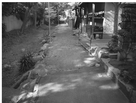
舗装工事が決まった泉小学校の通学路

〔!〕四条ふるさとまつりの地車曳行のときに、クラッカーの紙が付着したものです。今後は、ふるさとまつり事務局にこのような行為を起こさないよう申し伝えたいと考えています。