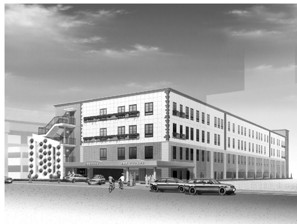
住道駅前駐車場・自転車駐車場完成イメージ図

字です。国保事業の健全な運営のため、また、受益者負担公平の原則から、収納率向上になお一層の努力が望まれます。