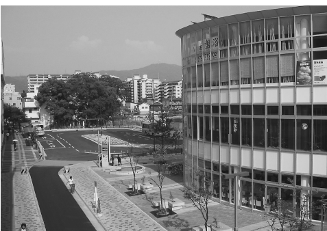
整備が進む住道駅南地区