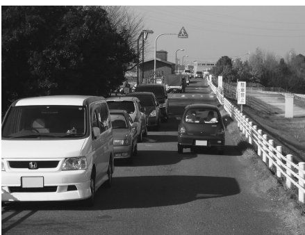
不法駐車の多い緑地西橋付近

(2)市民の多様なニーズに応えるには、行政改革を支える職員の個々の能力向上と意識改革が必要不可欠です。長期的展望に立った人材育成基本方針を、早急に確立すべきではありませんか。市民サービスの送り手としての意欲や、