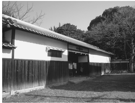
保存が望まれる平野屋会所

引き続き成り行きを慎重に見守るとともに貴重な文化遺産である平野屋会所の保存に向けて、関係部局とも調整を行います。もし市が取得できたならば、市民の皆さんに一般開放する考えです。