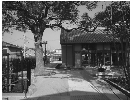
平成19年1月13日にオープンした野崎まいり公園

(2)4月に市の機構改革が行われます。来庁した市民が混乱しないよう、フロアマネジャーを配置できませんか。