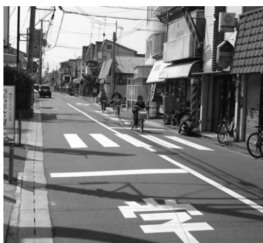
自動車・自転車・歩行者の通行が多く、整備による安全の確保が望まれる府道鴻池新田停車場線

A 現在、周辺整備の計画はありませんが、府道鴻池新田停車場線の整備は重要と認識しており、歩行者の安全確保のため、引き続き府に整備を要望していきます。