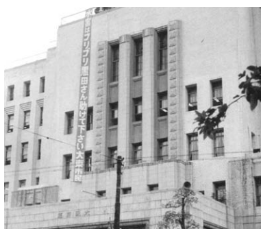
昭和47年の水害時に府庁本館の屋上から掲げられた垂れ幕「水害はコリゴリ 黒田さん助けて下さい 大東市民」とある

約40年が経過しています。府は、護岸の塗装を約10年ごとに塗り替えるとともに、水中部分の詳細点検を5年ごとに行い、長寿命化を図っているとのこと。府と連携し、寝屋川護岸の適切な維持管理に努める考えです。