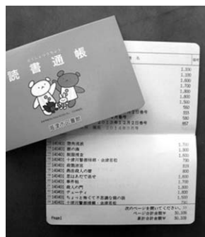
図書館で借りた本の書名、日付 が記録される読書通帳(例)

決められた時間しか利用でき ないなど、うまく活用されて いません。専従の司書を派遣