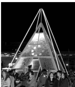
平成25年12月に末広公園などで開催された大東市スマイルミネーション(写真はメッセージツリー)

A 多くの市民が参画できる体制を早期に整え、本市ならではのイベントに育てていく考えです。