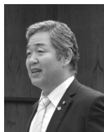
飛田 茂 議員

A 図書館に親しむきっかけとなるイベントの開催や、児童施設への働きかけによる将来の利用者の開拓など、図書館の利用者増に力を入れていく考えです。