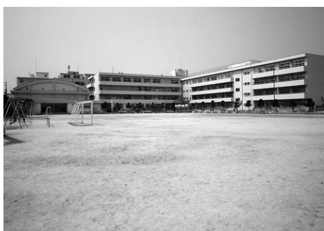
(2)広く市民に利用されている小・中学校の運動場・体育館 (写真は四条小学校)