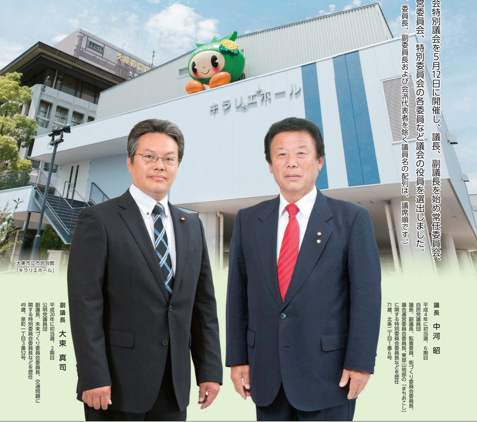
大東市立市民会館 「キラリエホール」

市議会特別議会を5月12日に開催し、議長、副議長を始め常任委員会、議会運営委員会、特別委員会の各委員など議会の役員を選出しました。 (本文中、委員長、副委員長および会派代表者を除く議員名の配列は、議席順です。)