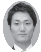
児玉 亮議員 (大阪維新の会)

問 (1)子どもの貧困が深刻な社会問題となっています。本市の実情に応じた施策を実施するためにも、実態調査を早期に実施すべきではありませんか。