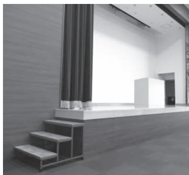
昇降機の設置が望まれる市民会館キラリエホール(曙町)のステージ

答 (1)高齢者・障害者の利用を考慮し、市民会館キラリエホールのステージに昇降装置を設置できませんか。