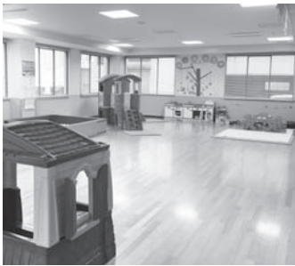
1歳以上の就学前児童を対象に休日保育を実施している大東市立キッズプラザ(幸町)

●民間事業者でできるのであれば、それを応援していく形で実現できると考えており、提案していきます。