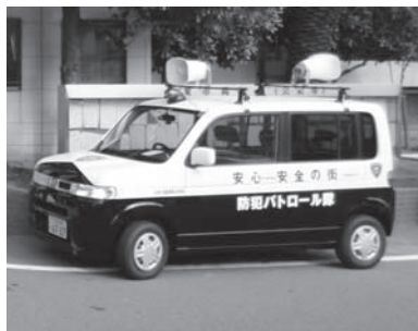
街頭犯罪の抑止や子どもたちの安全確保に効果がある青色防犯パトロールカー(例)