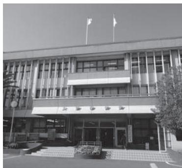
築52年が経過し、建て替えについて議論されている市役所本庁舎(谷川1丁目)

答 現在、新庁舎整備基本計画を策定中です。素案がまとまれば、住民説明会で整備のメリツトなどを丁寧に説明していく考えです。