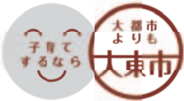
「子育てするなら大都市よりも大東市」のロゴマーク

答 「切れ目ない子育て支援」を重点施策に位置付け、妊娠期から出産、子育て期、教育に至る一貫したサポート体制の構築を図ります。既存ストックの活用や公民連携の手法により、「子育てするなら大都市よりも大東市」のブランドメッセージに沿った取り組みを進める考えです。