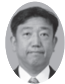
北村 哲夫議員 (自民党翔政会)