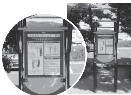
大東中央公園(深野1丁目付近)に設置されているストレッチ器具

答 現在、10の都市公園で設置しており、今後も公園などの再整備の際に、意見を聞きながら設置していく考えです。