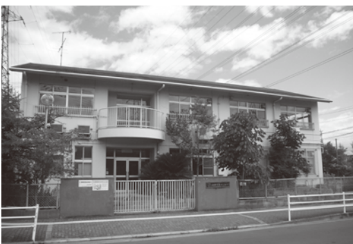
有効な活用により豊かな市民サービスの提供が望まれる深野児童センター跡地（深野3丁目）

答 諸福児童センター跡地は、子育て支援機能を持つ施設とする利活用を考えています。深野児童センターは、地域交流の場などの様々な可能性を考慮し、その有益性を研究しています。両センターとも、民間活力を導入し、豊かな市民サービスを提供できるように努めていきます。