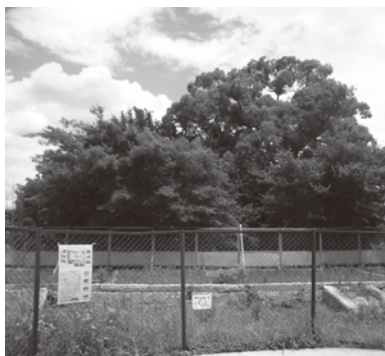
整備に向けた取組みを検討している平野屋新田会所跡(平野屋1丁目)