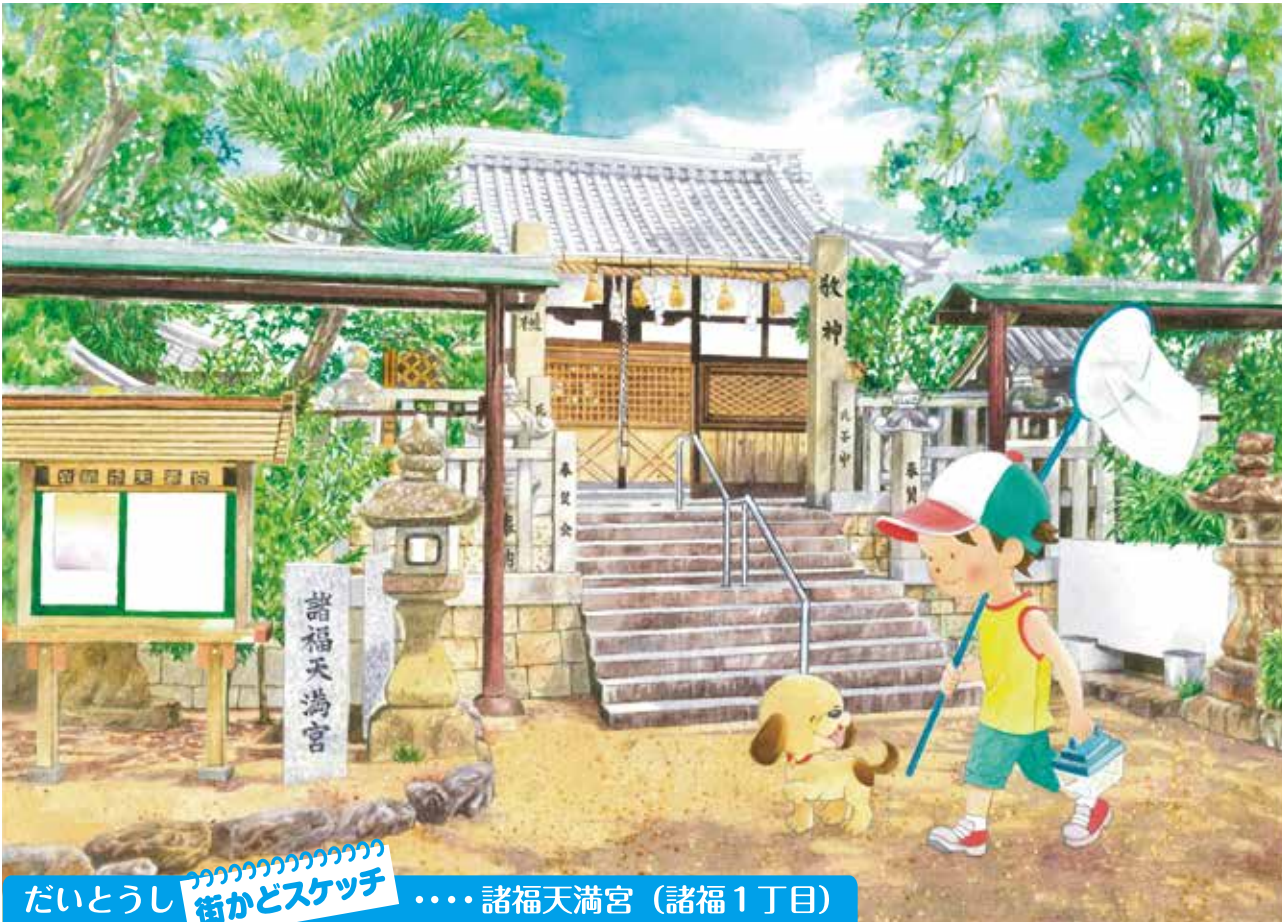
だいとうし 街かどスケッチ …… 諸福天満宮 (諸福1丁目)

1644年(寛永20年)にこの地に勧請され、菅原道真を祭神としています。市の文化財に指定されている本殿内の社の円柱等に見られる彫刻は、江戸初期の桃山建築様式を残します。また、境内には歯痛によく効くといわれる歯神さんが祀られています。