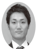
児玉 亮 議員